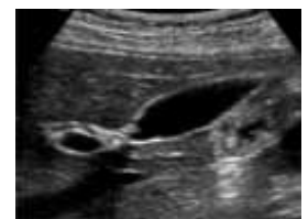
Ultrasonido: vesícula biliar

El ultrasonido se utiliza para ayudar a diagnosticar distintas dolencias, tales como: